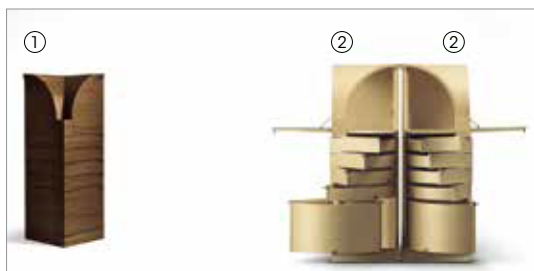
1 Nyn 51641 fin.11